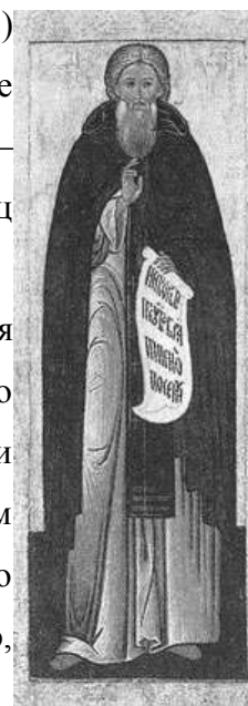
Сергей Радонежский. Икона. 1-я четв. XVII в.

Ветер рассеял туман, и перед русскими предстала грозная картина. Десятки туманов врага медленно продвигались к полю Куликову, поросшему высоким ковылем и полынью. Две рати остановились друг перед другом. Из рядов степняков выехал с копьем непобедимый поединщик Челибей. Готовых отдать жизнь за Святую Русь, за веру православную в войске Дмитрия Ивановича было много, но... как победить Челибея, чтобы воодушевить соотечественников?